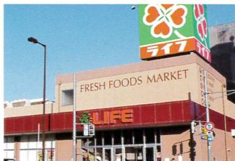
スーパー・ライフ

※福祉を受けておられる方もご相談ください。 ※上記料金はあくまでも参考例です。 料金詳細につきましては、お気軽にご相談ください。